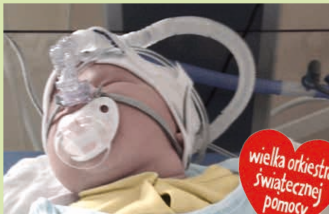
Dziecko podłączone do Infant Flow