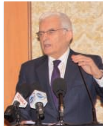
prof. Jerzy Buzek