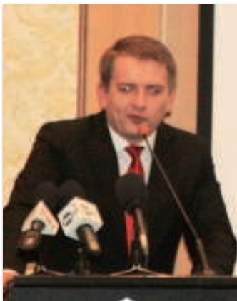
Bartosz Arłukowicz minister zdrowia