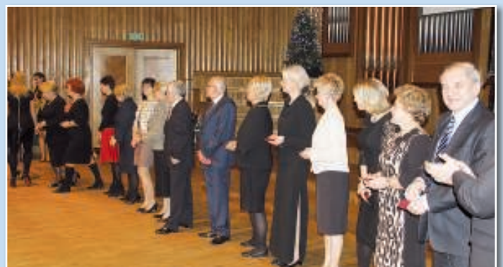
Zdjęcia pochodzą ze zbiorów Szpitala im. Jurasza